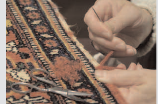
Lösa trådar på stadkanter utmed mattans långsida åtgärdas bäst med en kastsöm.