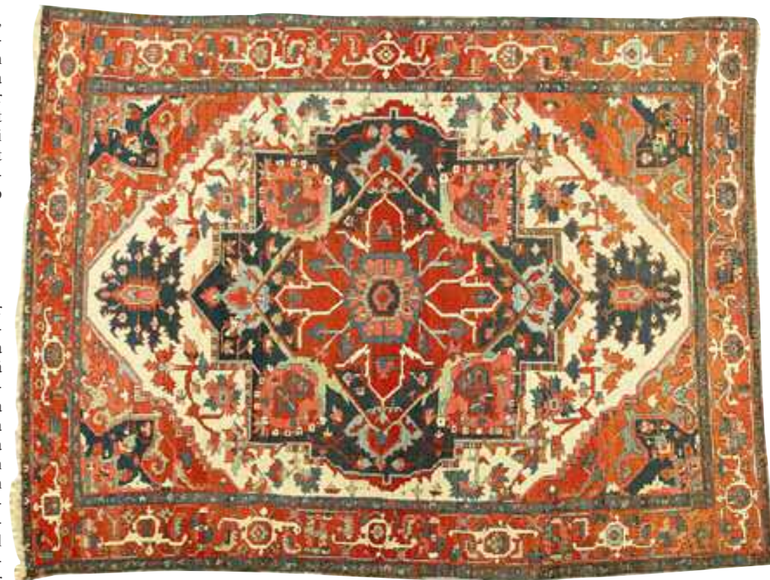
Herizmattor har blivit lite billigare under senare år. Här en trevlig antik heriz med lagningar och något reducerade kortsidor, 387x292 cm, som klubbades för 30 000 kr, en bra bit under utropspriset som var 80 000–100 000 kr på Stockholms Auktionsverks Stora värkvalité förra våren.

– En stoppsöm som snyggar till trasiga kortsidor och förhindrar fortsatt slitage går på cirka 425 kronor per timme, och på den tiden hinner jag med ungefär en meter. Nya fransar kan dra ned värdet på en gammal matta och ibland är det bättre att nöja sig med just en stoppsöm, men behålla originalfransen även om den är kort och stubbig. Kastning av en stadkant med en enkel kabel (mattor kan ha upp till fyra kablar på långsidorna) ligger på samma pris som för stoppsömmen och man hinner med lika mycket, det vill säga en meter på en timme.