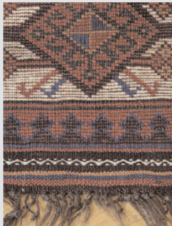
Handknutna mattor som den här nomadmattan har horisontella rader på baksidan längsmed fransarna där man ser inslagstrådarna. Maskinknutna mattor har i stället lodräta rader som går från frans till frans. Mattan är knuten på brun yllevarp och har kvar kelimavslutningen, som annars ofta är bortnött på äldre mattor.